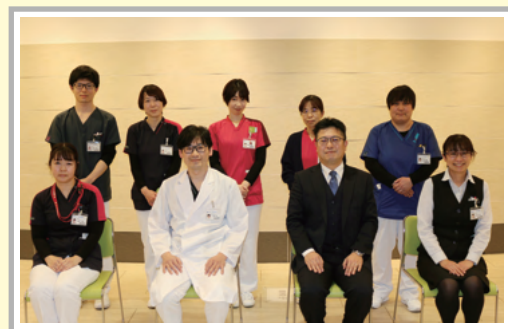
患者サービス向上委員会

患者サービス向上委員会では、接遇の強化とサービス向上に取り組んでいます。主な活動は、患者さんへのアンケート活動・患者様の声(ご意見箱)・職員の接遇マナーの啓発を行っています。接遇マナーでは定期的に研修会を行い、見本となる職員を身だしなみ接遇リーダーとして認定し、全職員の意識を高めて接遇向上に努めています。また、患者様の声からのご意見より、外来にシルバーカーを導入、正面玄関の滑り止め加工等を行い、サービスの向上にも努めています。ご意見・ご要望がございましたら、患者様の声(ご意見箱)をお気軽にご利用ください。(匿名でのご利用も可能です。)