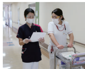
病棟回診時の様子

外来通院患者さんは歯周病治療をしながら個々の口腔状況に合わせてブラッシング指導を、療養病棟入院患者さんへは歯科衛生士が定期的に病棟回診を行い看護師による口腔ケアで対応困難な患者さんや、非経口摂取で口腔乾燥が顕著な方への口腔衛生管理をしています。また、入院中に限りませんが言語聴覚士による摂食機能療法や脳血管疾患等リハビリテーションなどの介入時と造影剤による嚥下機能検査前には歯科口腔外科受診をしていただき、適切なリハビリや検査を受けられるように配慮しています。そのほか医科にて悪性腫瘍等の手術を受けられる患者さんや化学療法を受けられる患者さんに対し術前等口腔機能管理を実施しています。手術前、化学療法前から口腔内の状況を把握し、術後性肺炎や術後期における歯の損傷、口内炎や口腔粘膜炎の予防に力を入れています。